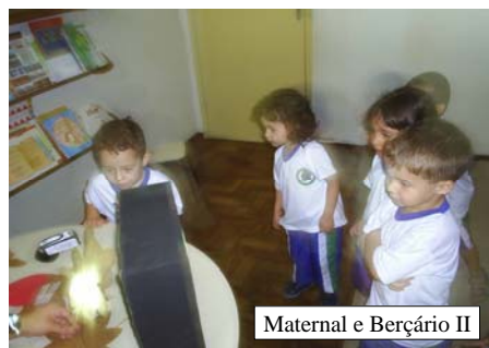
Maternal e Berçário II

TEATRO DE SOMBRAS : O teatro foi confeccionado com uma caixa de papelão pintada toda de preto, na sua abertura foi colocado papel de seda branco e para sua realização utilizamos fantoches com color sete preto e palitos de churrasco, com o auxílio da lanterna atrás do teatro era possível refletir sua sombra para as crianças que estavam na frente assistindo.