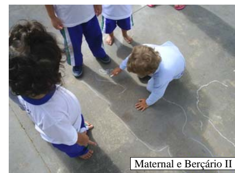
Maternal e Berçário II

TEATRO DE SOMBRAS : O teatro foi confeccionado com uma caixa de papelão pintada toda de preto, na sua abertura foi colocado papel de seda branco e para sua realização utilizamos fantoches com color sete preto e palitos de churrasco, com o auxílio da lanterna atrás do teatro era possível refletir sua sombra para as crianças que estavam na frente assistindo.