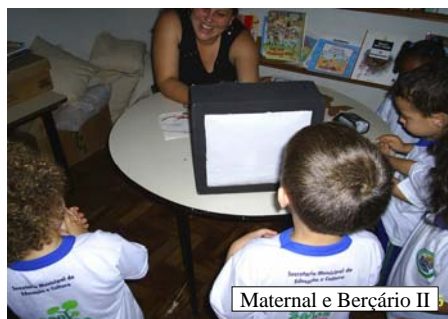
Maternal e Berçário II