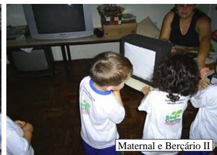
Maternal e Berçário II

Percebemos que atividade que mais chamou a atenção das crianças foi a que fizemos com o retroprojetor