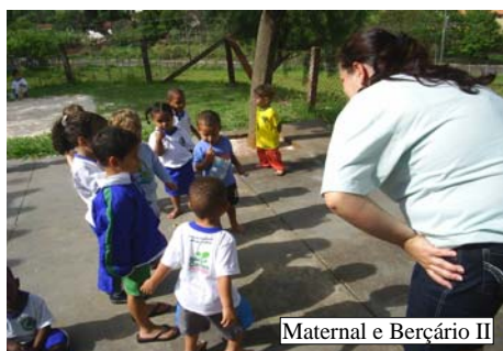
Maternal e Berçário II

BRINCANDO NO PÁTIO : aproveitamos o sol para que as crianças pudessem reproduzir as próprias sombras no chão, elas imitavam avião abrindo os braços, correndo por todo lado e tentando reproduzir o som do mesmo, fizeram o contorno da sombra do corpo no chão com giz.