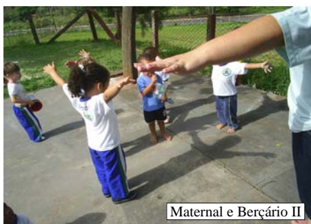
Maternal e Berçário II