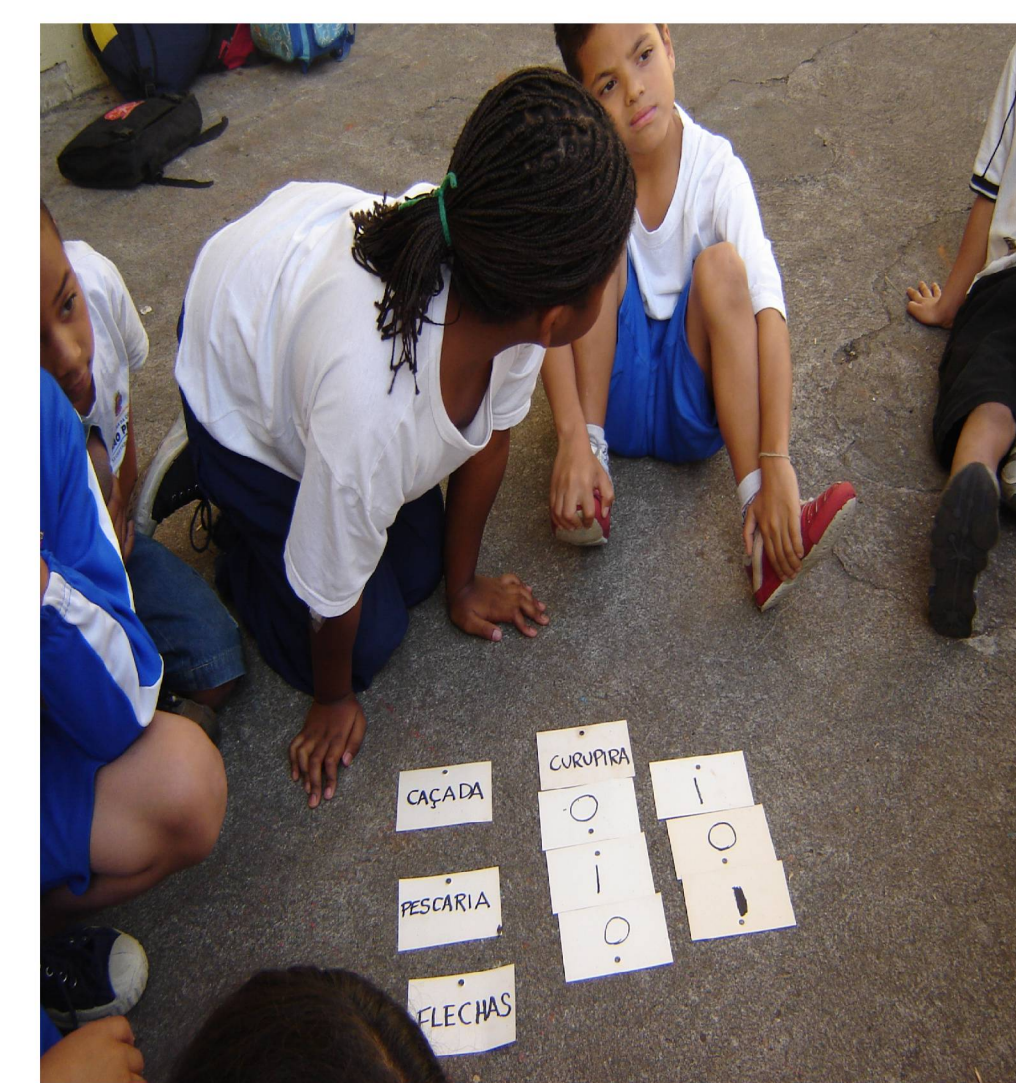
Necessidade da criação da escrita e dos números