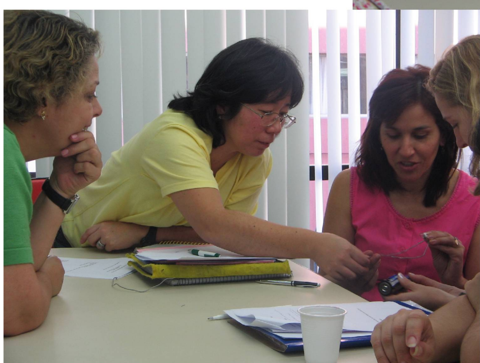
Fotos do 6º Encontro com os Coordenadores Pedagógicos