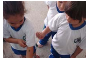
Saída a campo