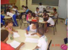
Registrando as hipóteses.