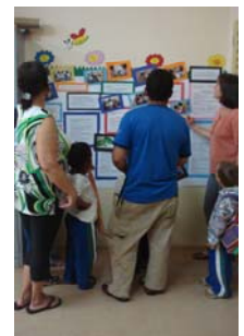
Pais de alunos observando painel referente a pesquisa realizada.