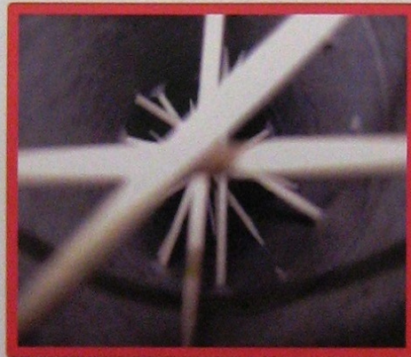
Pau da Chuva visto por dentro