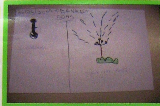
Sons e Ruídos