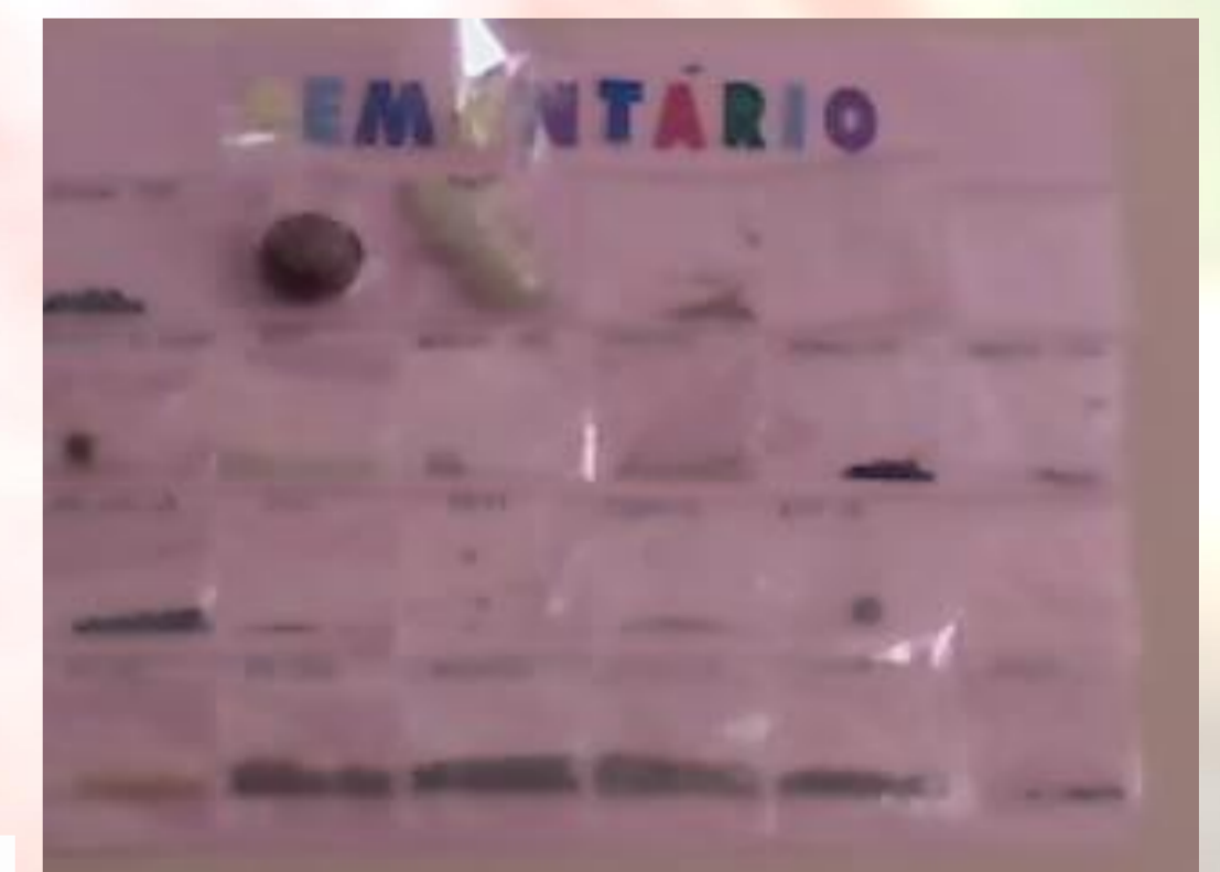
Figura 4 – Organização do sementário

Para finalizar todas as crianças plantaram uma sementinha e levaram para casa para continuar o processo de observação e cuidados.