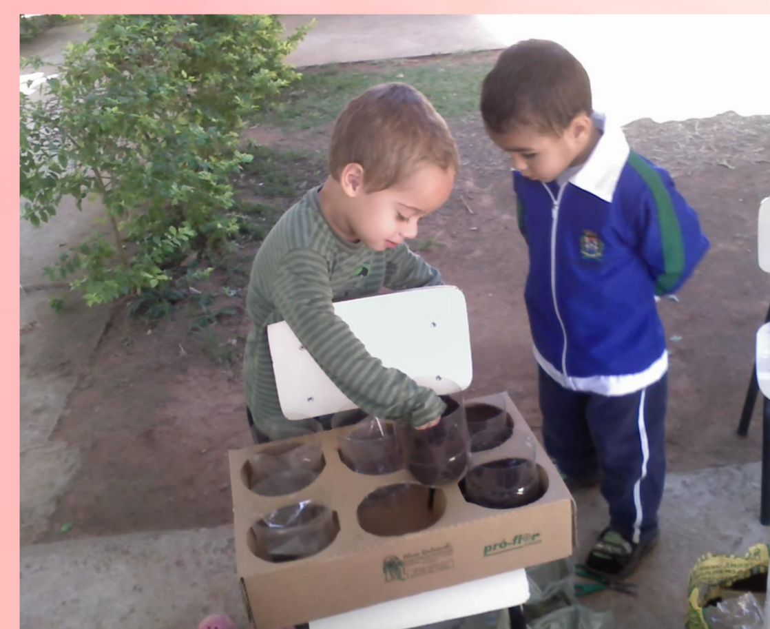
Figura 5 – Plantio das sementes: maçã, feijão, mamão, abacate, girassol e bucha vegetal