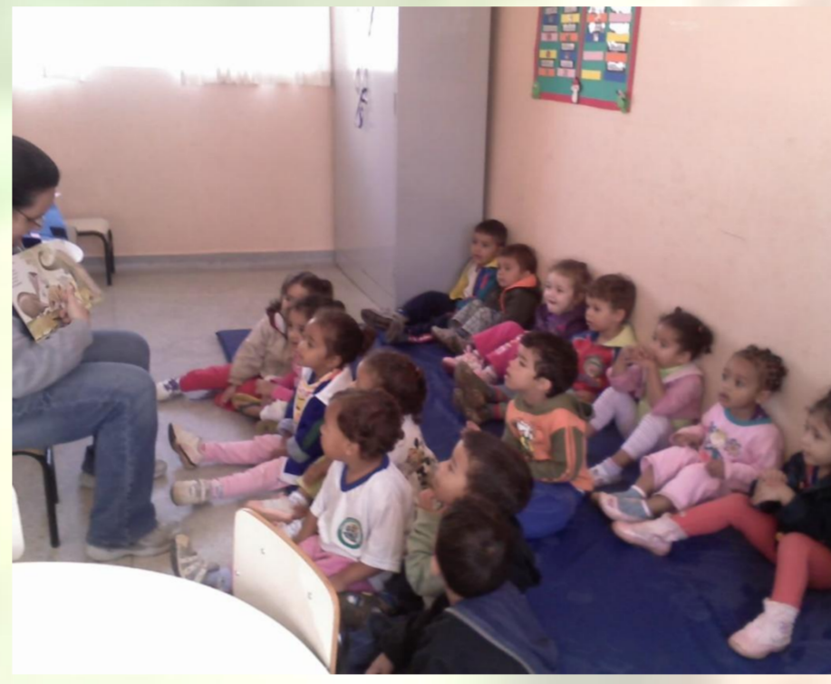
Figura 1- Crianças ouvindo a história "O Bichinho da maçã"