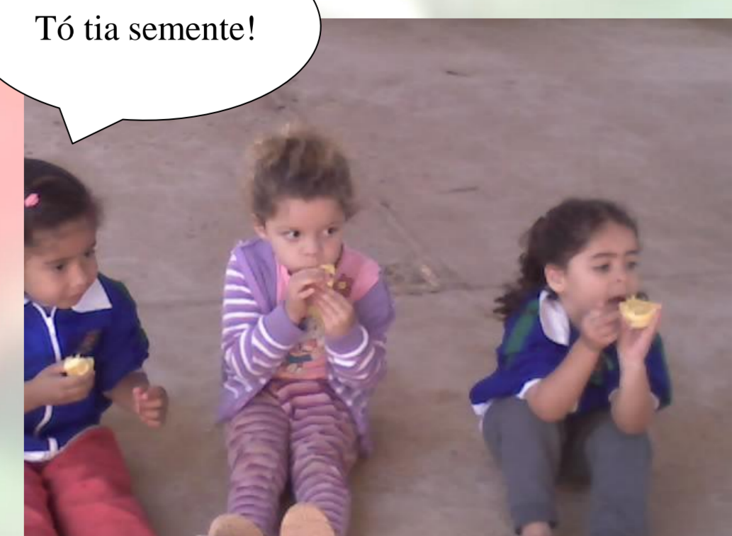
Figura 11 – Crianças comendo laranja