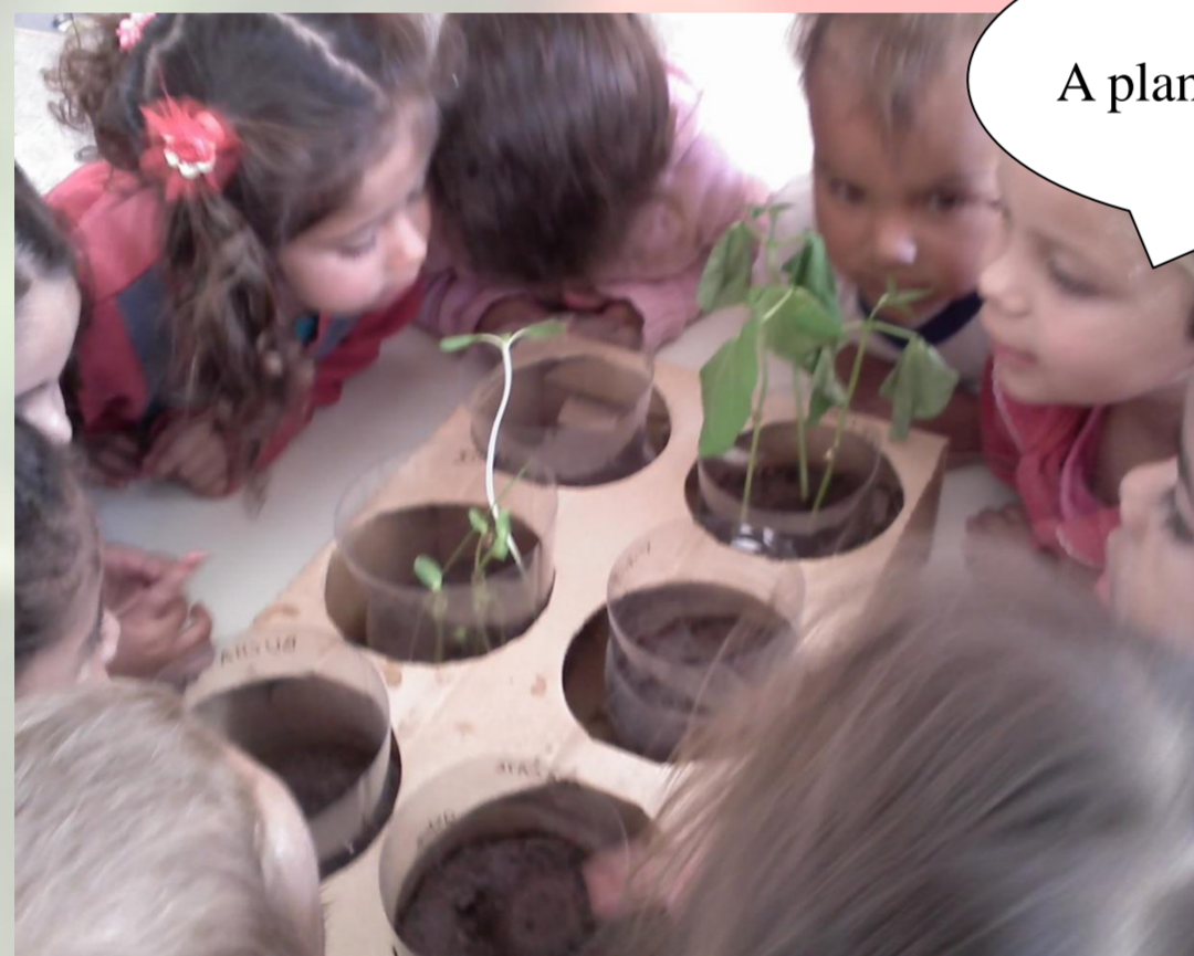
Figura 7 – Crianças observando as plantinhas

Na sequência enviamos uma pesquisa para casa e as crianças, com ajuda dos responsáveis, coletaram várias sementes e levaram para a escola, onde organizamos um sementário.