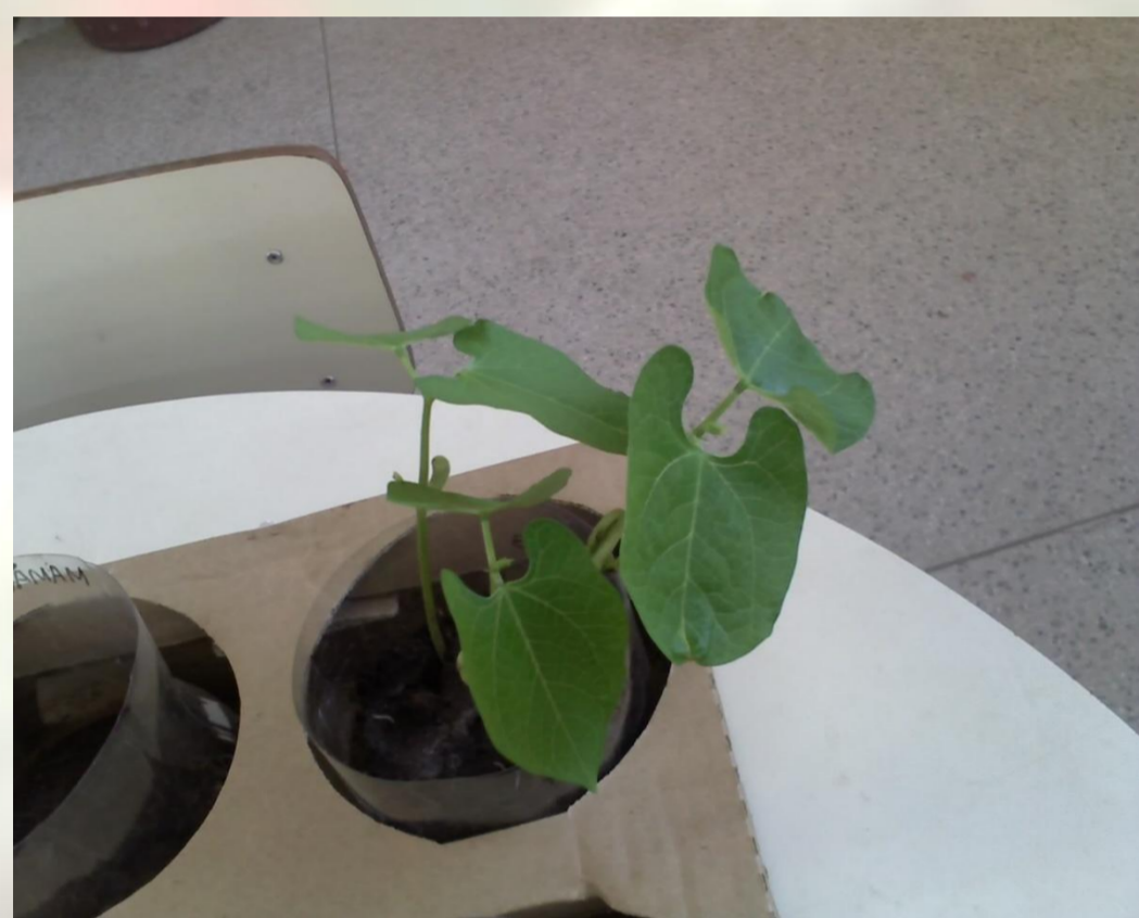
Figura 8 – Germinação das sementes: Feijão

Foi lida então, a história "O bichinho da maçã" do Ziraldo para comparar a semente da maçã (que eles diziam ser bichinho) ao bichinho da maçã da história. Porém, as crianças continuaram afirmando que a semente era bicho.