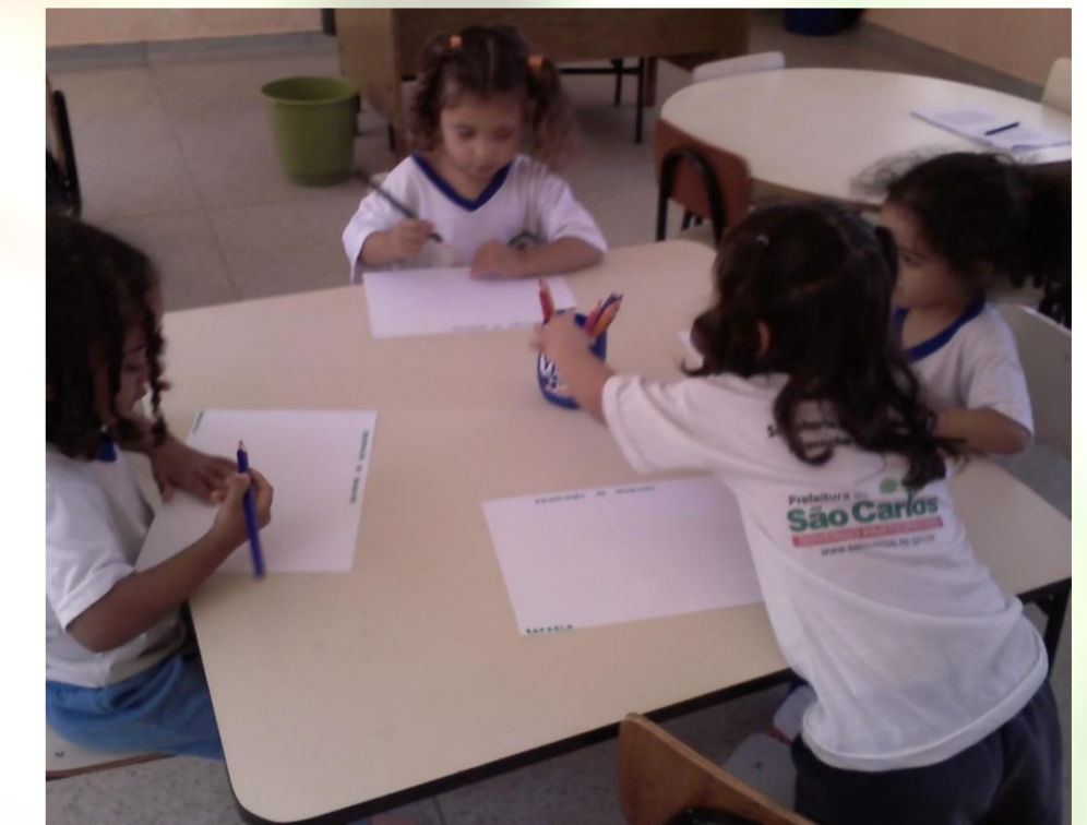
Figura 3 – Registro das crianças