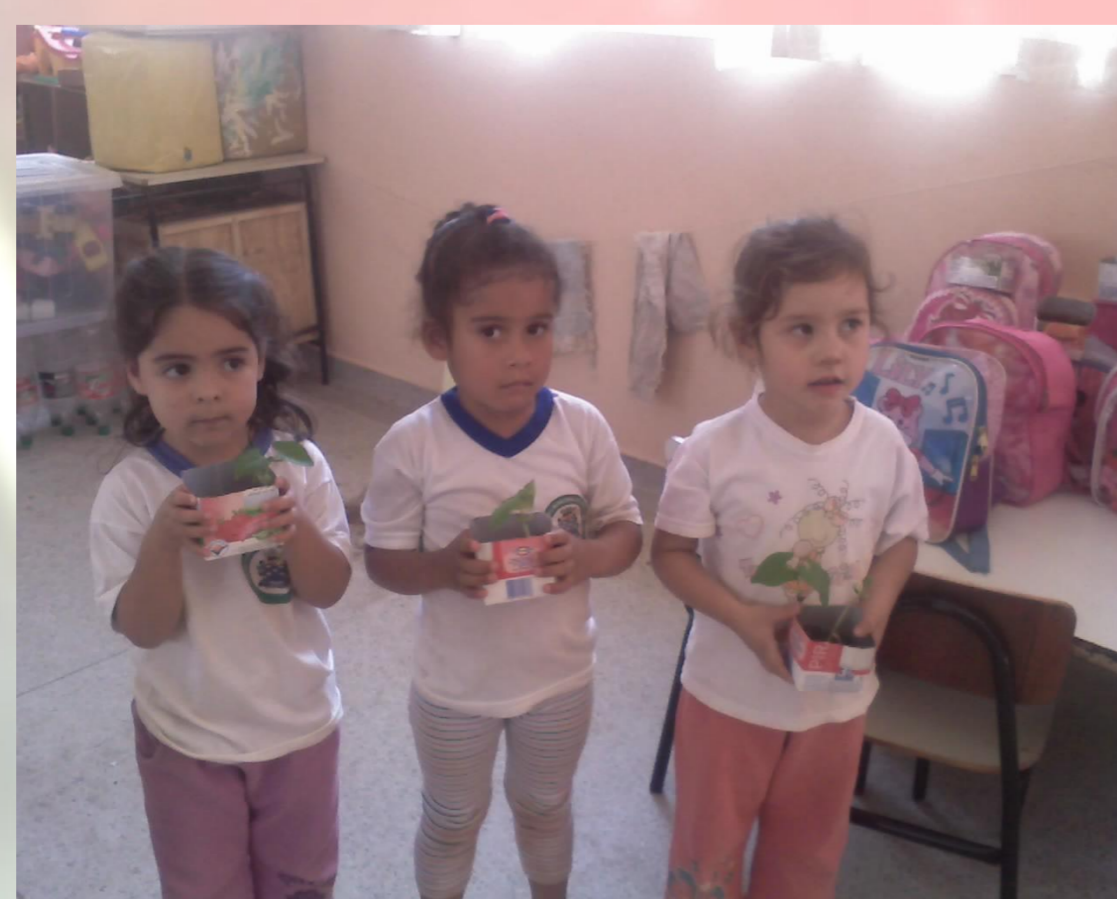
Figura 10 – Crianças com as "plantinhas" para cuidar em casa

Para finalizar todas as crianças plantaram uma sementinha e levaram para casa para continuar o processo de observação e cuidados.