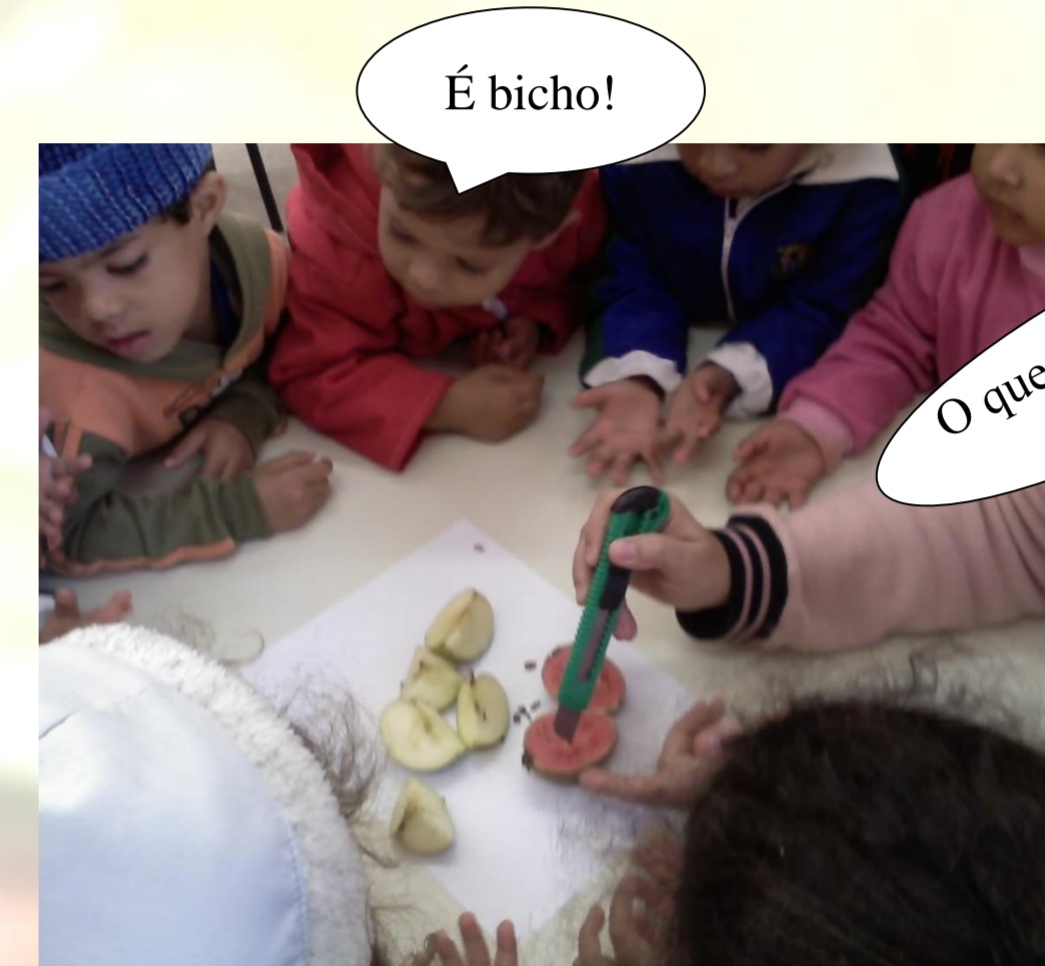
Figura 2 – Observação da maçã e da goiaba