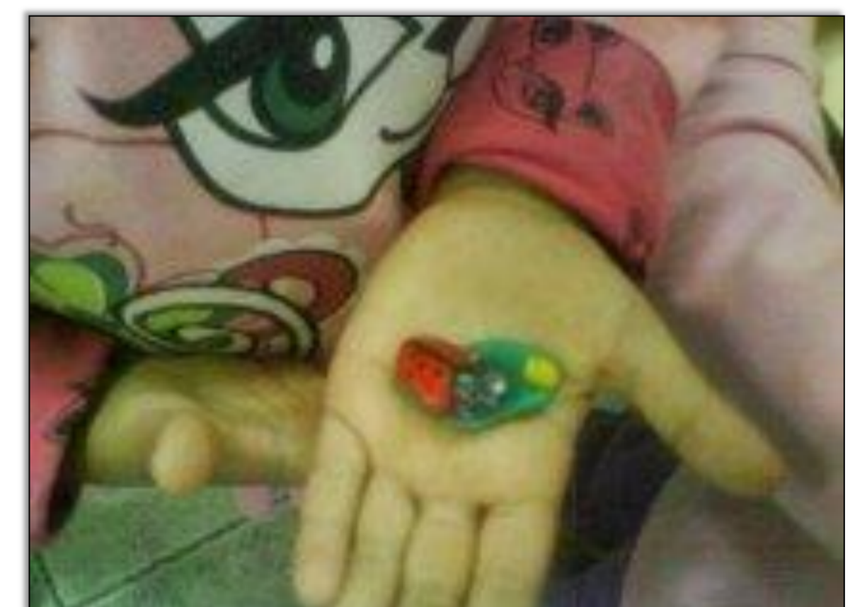
Pintando o pedregulho que simboliza a joaninha