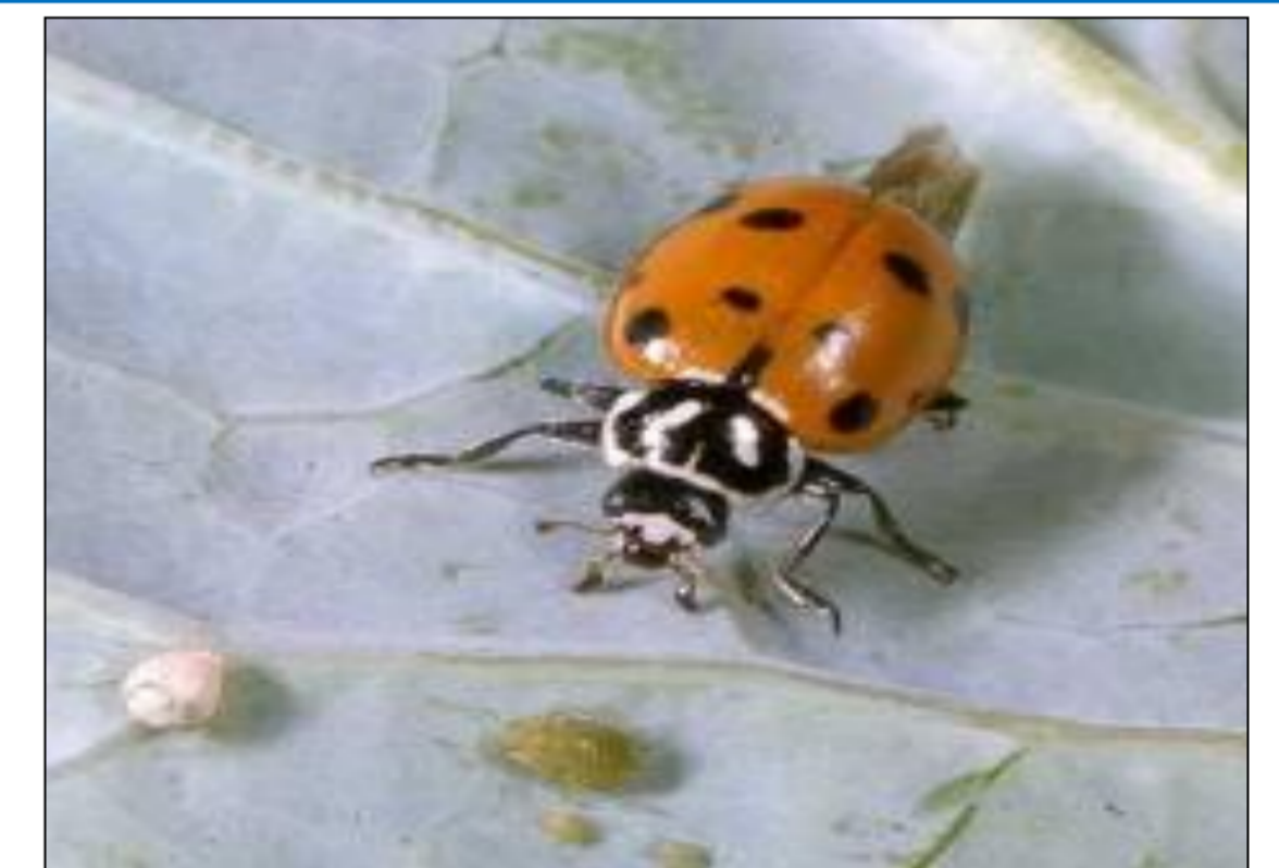
Joaninhas se alimentando de pulgões