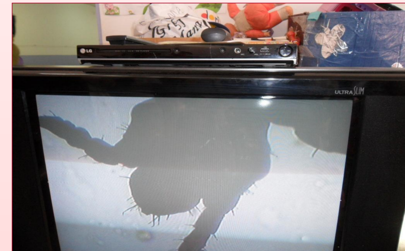
Figura 2- Imagem do piolho projetada na televisão

O uso do microscópio para crianças dessa faixa etária não foi muito eficaz, pois não conseguiram visualizar o piolho olhando na lente por serem pequenos demais para achar o foco. Então, optamos por lupas, mostramos o piolho inteiro, pois na projeção ele foi visto por partes.