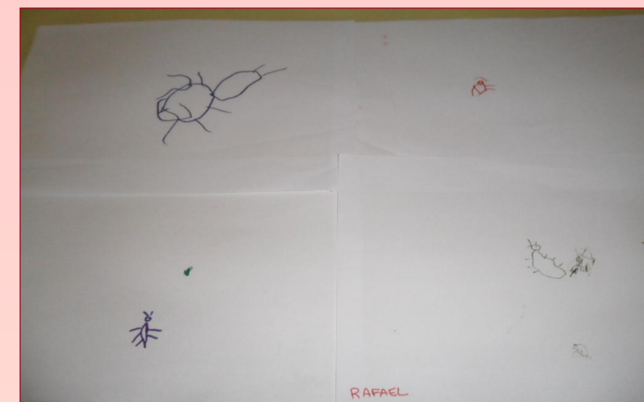
Figura 3- Desenho final, o piolho foi desenhado com riqueza de detalhes

Para finalizar, os alunos desenharam o piolho com as novas hipóteses formadas (figura 3), agora com grande riqueza de detalhes. Em seguida colamos no mural e junto com as crianças comparamos com os desenhos realizados no início das atividades.